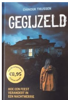
Een boek voor klas 3 i.v.m. het project 'Er was eens.....'