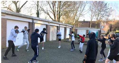
Een les buiten boksen bij LO