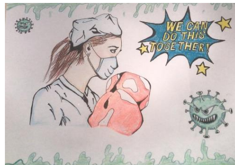
Een tekenopdracht om bij een congres de zorg een 'hart onder de riem' te steken